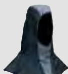
16 91 00