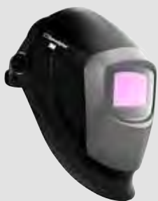
40 13 85