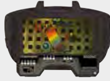
Welding filter (only)