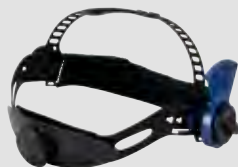
70 50 15