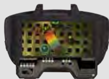
40 00 85