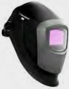
Helmet with auto-darkening filter