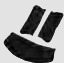
16 40 05