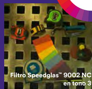
Filtro Speedglas™ 9002 NC en tono 3