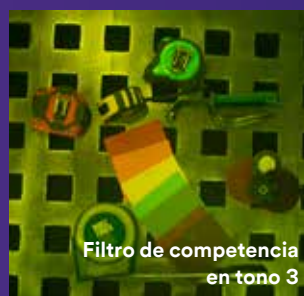
Filtro de competencia en tono 3