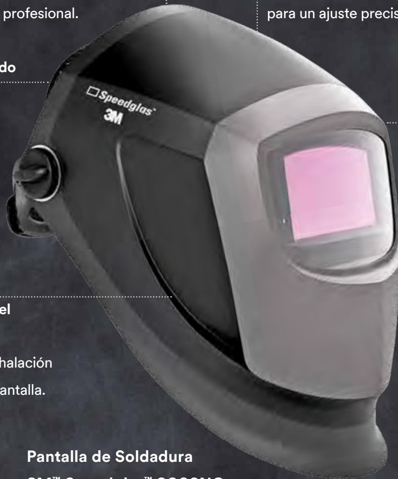
Pantalla de Soldadura 3M™ Speedglas™ 9002NC

Con salidas de exhalación integradas en la pantalla.